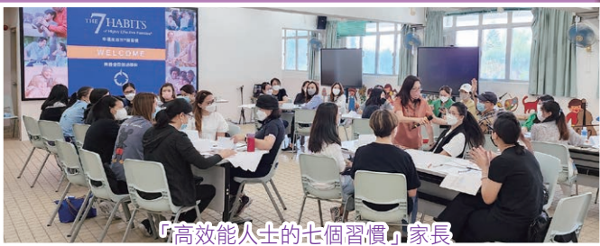
「高效能人士的七個習慣」家長

為了協助家長共同培養子女的七個習慣，學校訓輔組特意舉辦相關的家長講座及工作坊，讓家長了解「高效能人士的七個習慣」，家長亦可以分享如何發揮「七個習慣」，從分享中提升家長對孩子的管教方式和相處技巧，並為孩子締造一個全面的實踐環境，以讓家長與孩子共同成長及創造成功的人生。