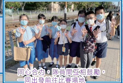
同心合力，隊員間互相鼓勵，一同出發前往比賽場地