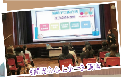
《開開心心上小一》講座

本校本年已舉行了4場家長講座，分別為《開開心心上小一》講座(18/11)、《如何與孩子有效溝通》講座(22/11)、《高效能人士的七個習慣》講座(28/11)及《處理子女的情緒》講座(2/12)。