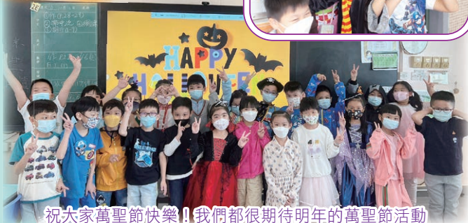
祝大家萬聖節快樂!! 我們都很期待明年的萬聖節活動

為提升同學學習英語的興趣和了解西方節日的文化，本校英文科於十月三十一日（星期一）小息期間舉辦萬聖節派糖果活動「Trick-or-Treating」。為提升節日氣氛，當天師生們都悉心打扮，同學在小息時向老師背誦萬聖節詩歌和領取糖果，氣氛熱鬧，師生共度了愉快的一天。