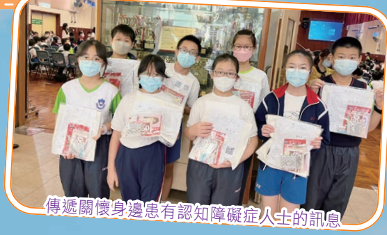
傳遞關懷身邊患有認知障礙症人士的訊息