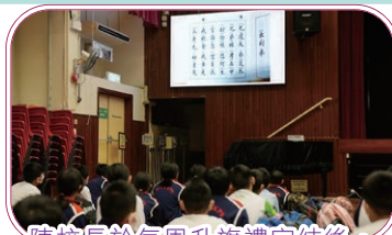
陳校長於每周升旗禮完結後，都會向學生講解《弟子規》