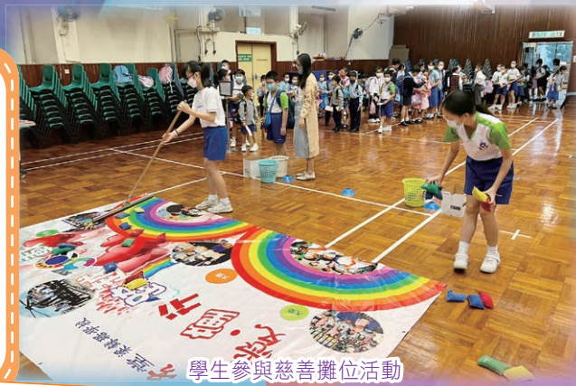
學生參與慈善攤位活動

今年的成績十分驕人！承蒙各家長踴躍捐輸，各學生熱心積極勸銷。本校今年榮獲全場最高籌款總額獎冠軍及小學組單位最高籌款額獎冠軍，全校籌款金額達$148,040。