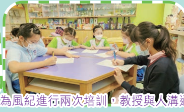
張姑娘為風紀進行兩次培訓，教授與人溝通的技巧