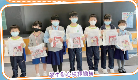
學生熱心積極勸銷