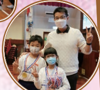
班代表從胡副校手中接過獎牌

為營造校慶歡樂氣氛，體育組於一至三年級分別舉辦三場校慶競技賽，冀望透過競賽活動培養學生的團隊精神和正面的價值觀及態度。各場比賽氣氛均非常熱烈，每一位參賽學生都奮力向前，為自己班爭奪佳績而努力！