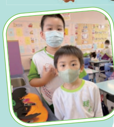
風紀與對象進行相認活動

本校啟發潛能教育組推行SCHOOL BUDDIES「伴你同行」計劃，邀請10位風紀參與計劃，透過平日的主動關懷，以及定期舉辦的小組活動，讓風紀得以支援及幫助有學習困難的小一學生紓解學習壓力及適應校園生活。與此同時，SCHOOL BUDDIES「伴你同行」計劃提供亦提供實踐機會，讓參與計劃的風紀可以體驗和實踐「與成功有約」中的「習慣五——知彼解己」。