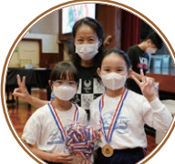
班代表從黃副校手中接過獎牌