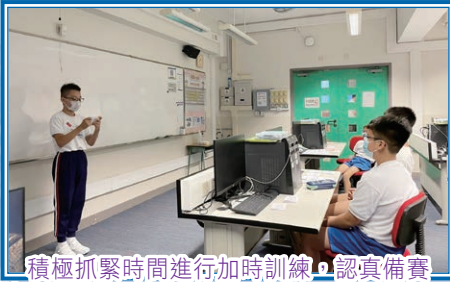
積極抓緊時間進行加時訓練，認真備賽