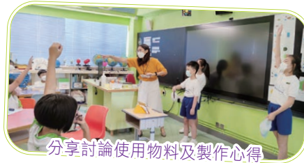
分享討論使用物料及製作心得