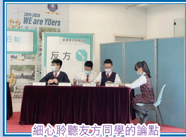
細心聆聽友方同學的論點