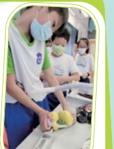
利用分貝儀進行物料測試

為配合最新的教學趨勢，本校常識科於五年級，每星期增加一節科技課，藉此激發學生的學習興趣，培養他們的綜合素質、動手及探究能力。老師會因應學生的能力設計專題活動，涵蓋STEAM教育的所有範疇，鼓勵他們把知識融會貫通，邁通過實踐解決問題。