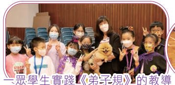
一眾學生實踐《弟子規》的教導，獲陳校長獎勵與她的愛犬共度愉快的時光