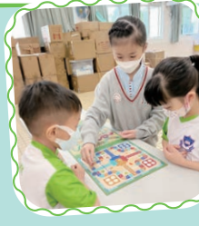
各種小組活動都很有趣味，大家都樂在其中