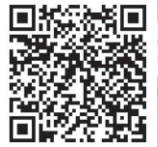
校外比賽獲獎紀錄 QR Code