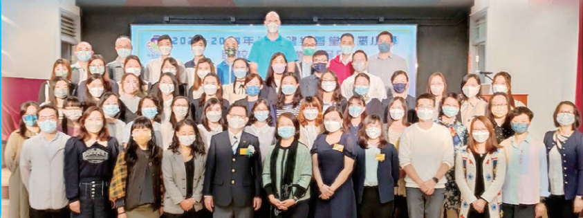
全體教師參與九龍樂善堂轄屬小學2022年度聯校教師專業發展日

九龍樂善堂轄屬小學聯校教師專業發展日已於2022年11月4日(五)舉行，當天由香港青年協會陳英杰先生主講「資訊素養知多少」，當中帶出資訊素養的定義、重要性、學習階段及學校領導者的角色等，並介紹了Project Net新媒體素養提升計劃的小學教材資源套，而下午則由教育局小學校本課程發展組陳陽明女士及香港創意閱讀教育協會會長董雅詩老師分別分享跨課程閱讀及實戰經驗。