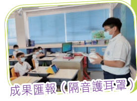
成果匯報(隔音護耳罩)