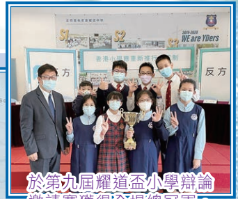
於第九屆耀道盃小學辯論邀請賽獲得全場總冠軍，隊員十分興奮