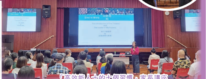
「高效能人士的七個習慣」家長講座