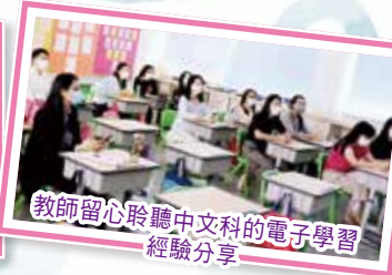
教師留心聆聽中文科的電子學習經驗分享