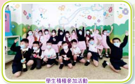
學生積極參加活動