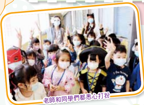
老師和同學們都悉心打扮