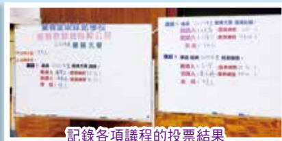
記錄各項議程的投票結果