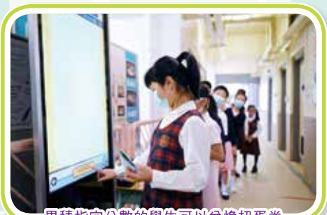
累積指定分數的學生可以兌換扭蛋券