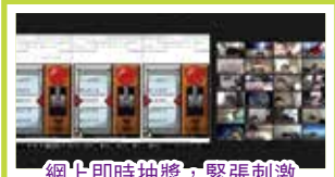
網上即時抽獎，緊張刺激