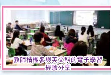
教師積極參與英文科的電子學習經驗分享