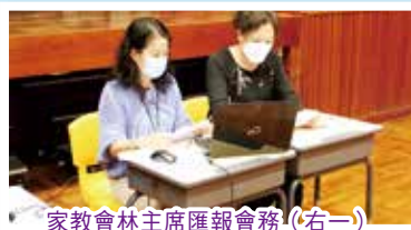
家教會林主席匯報會務(右一)