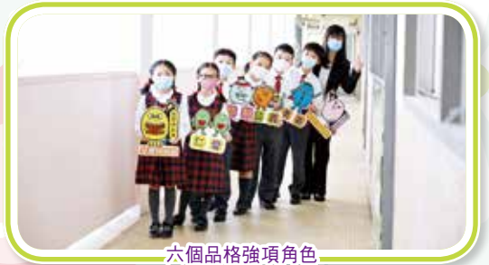
六個品格強項角色

截至十一月份，第一階段的扭蛋活動已經圓滿結束，全校逾七成學生儲滿指定積分，接近一半學生參與了扭蛋活動。學生對校本輔導活動表現出濃厚的興趣，並在各方面表現出令人欣喜的品格強項。第二階段的扭蛋活動如箭在弦，期望學生能夠繼續努力，成為具有良好品格的小公民。