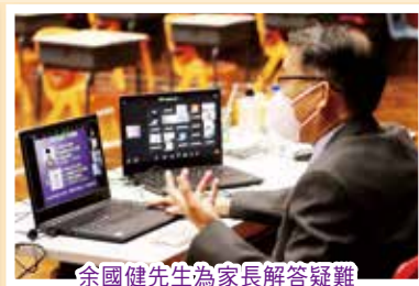
余國健先生為家長解答疑難