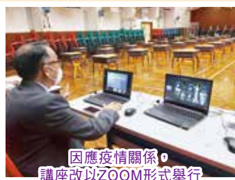
因應疫情關係，講座改以ZOOM形式舉行