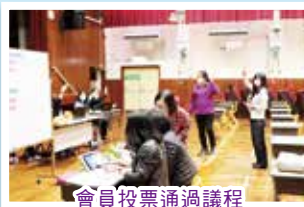
會員投票通過議程