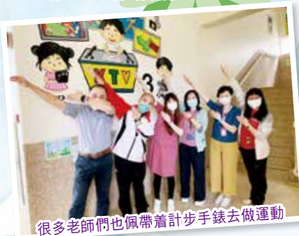
很多老師們也佩帶着計步手錶去做運動