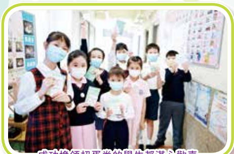
成功換領扭蛋券的學生都滿心歡喜