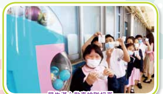
學生滿心歡喜排隊扭蛋