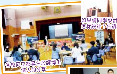
各校同工都專注於譚博士深入的分享