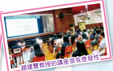
趙建豐教授的講座很有啟發性