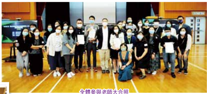
全體參與老師大合照

本校視藝科老師獲邀參加了2020/21「建立有效的對話及提問策略以促進創作」專業學習社群計劃。是次計劃，港九新界共有四所學校參與，並邀請得香港教育大學文化及創意藝術學系譚祥安博士作計劃顧問。全體視藝科任老師於2020年11月10日參加了第一次的工作坊，譚博士豐富的資料、對藝術作品深入的講解及引導老師進行高階的評賞教學，令大家獲益良多，相信對往後的評賞教育裨益不少。