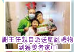
謝主任親自派送聖誕禮物到獲獎者家中